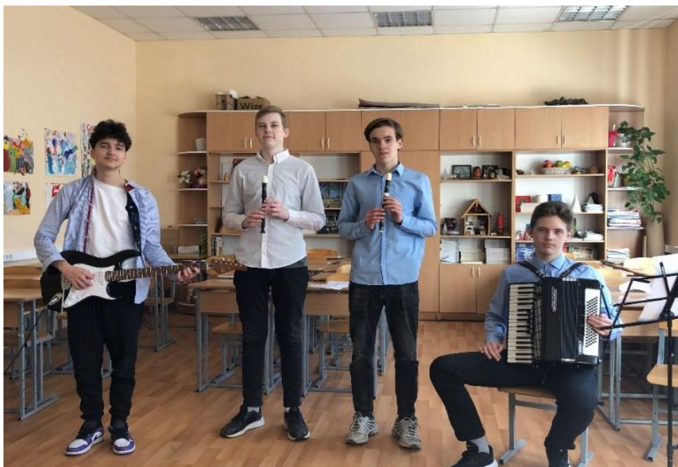
Игра на флейтах. Репетиция со старшим ансамблем «Ладо» (март 2022 года)

Вторая сложность – это читать по нотам. На каждого ученика составляется партитура – он читает (играет) её по фразам. При разучивании играем в медленном темпе, постоянно повторяем, чтобы запомнить движение руки, мелодию, ритмический рисунок. Важно на занятиях знание музыкального текста. Уметь следить во время игры играть свою партию, уметь ориентироваться в написанной и знать, в каком месте сейчас играет ансамбль. Стараемся, чтобы каждый играл свою мелодическую линию и выстраивает её по вертикали.